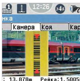
НАВЕДЕНИЕ С ПОМОЩЬЮ ЦИФРОВОЙ КАМЕРЫ