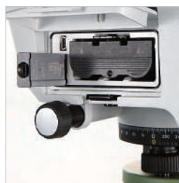
УДОБНЫЙ ОБМЕН ДАННЫМИ