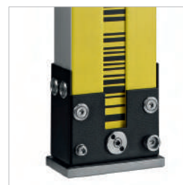
ИСПОЛЬЗОВАНИЕ КОДОВЫХ ИНВАРНЫХ РЕЕК