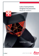
Оригинальные аксессуары Leica Geosystems