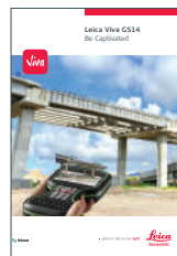
Leica Viva GS14