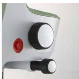
ВЫСОКАЯ ПРОИЗВОДИТЕЛЬНОСТЬ БЛАГОДАРЯ АВТОФОКУСИРОВКЕ