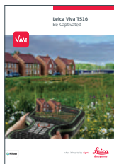
Leica Viva TS16

Иллюстрации, описания и технические характеристики могут быть изменены в одностороннем порядке. Все права защищены. Правообладатель Leica Geosystems AG, Хербрюгг, Швейцария, 2015. 841871en – 10.15 – INT